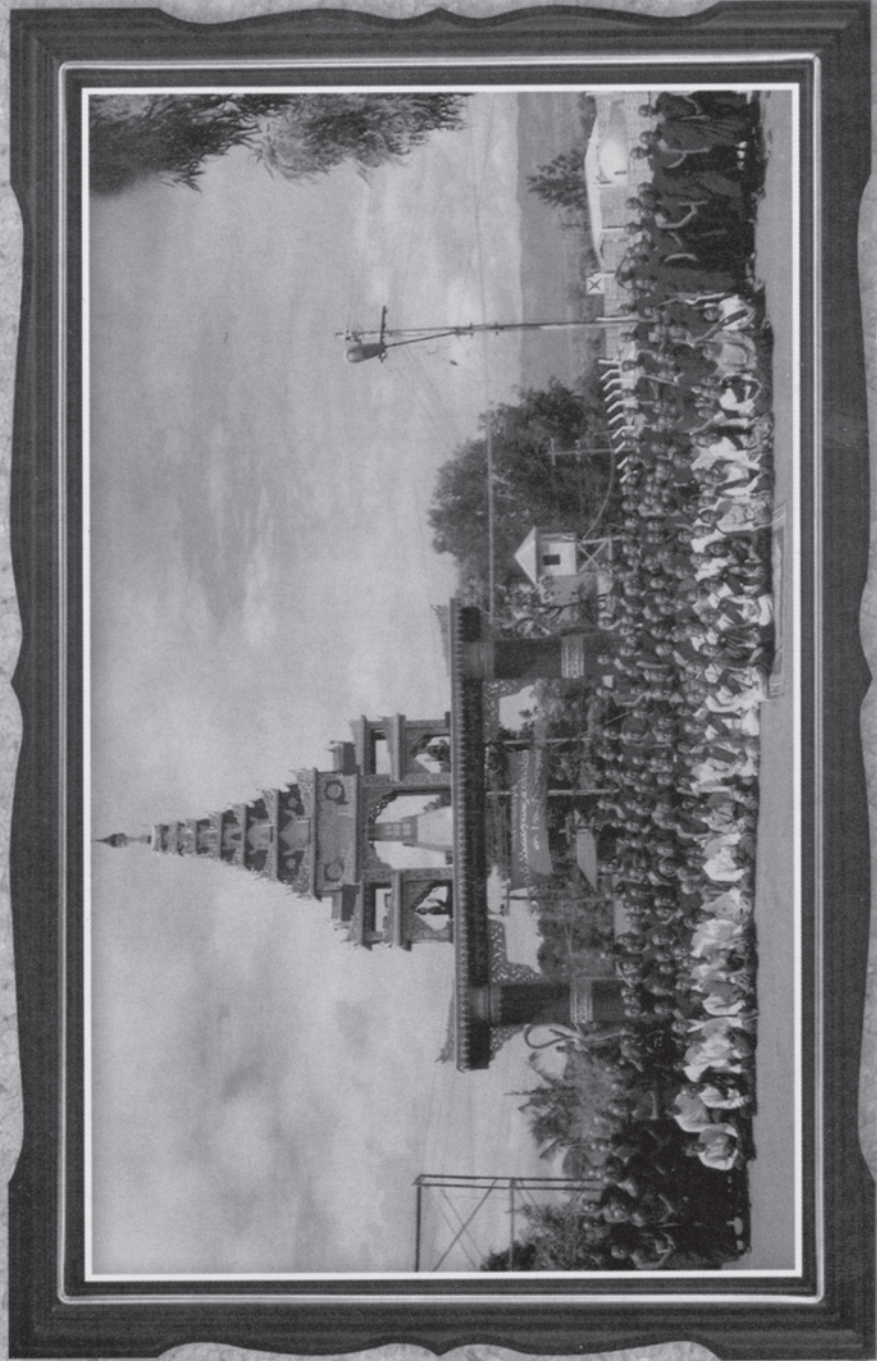
အထိမ်းအမှတ် (၁၉၆၅) ခုနှစ် နေပြည်တော် အထိမ်းအမှတ်