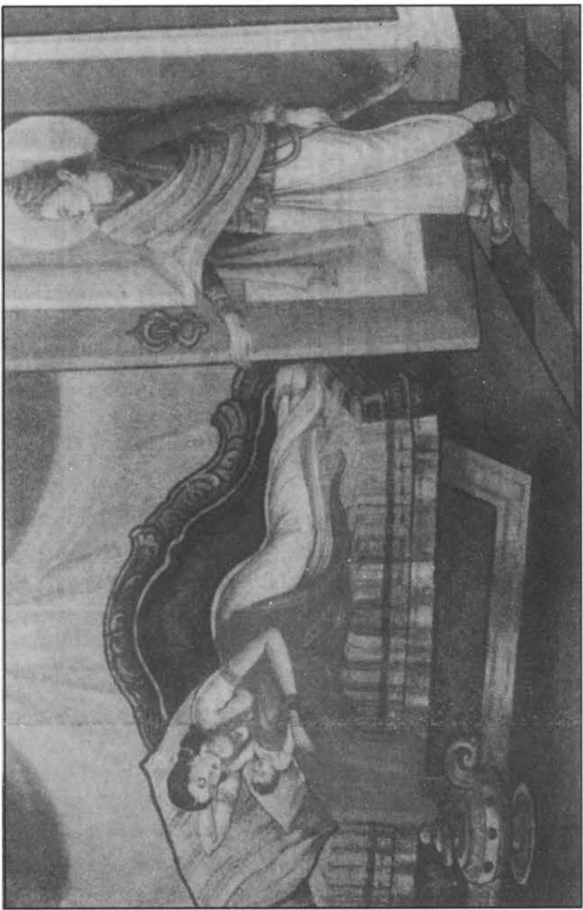
রাজকুমার সিদ্ধার্থের মহাঅভিনিক্রমণ ।