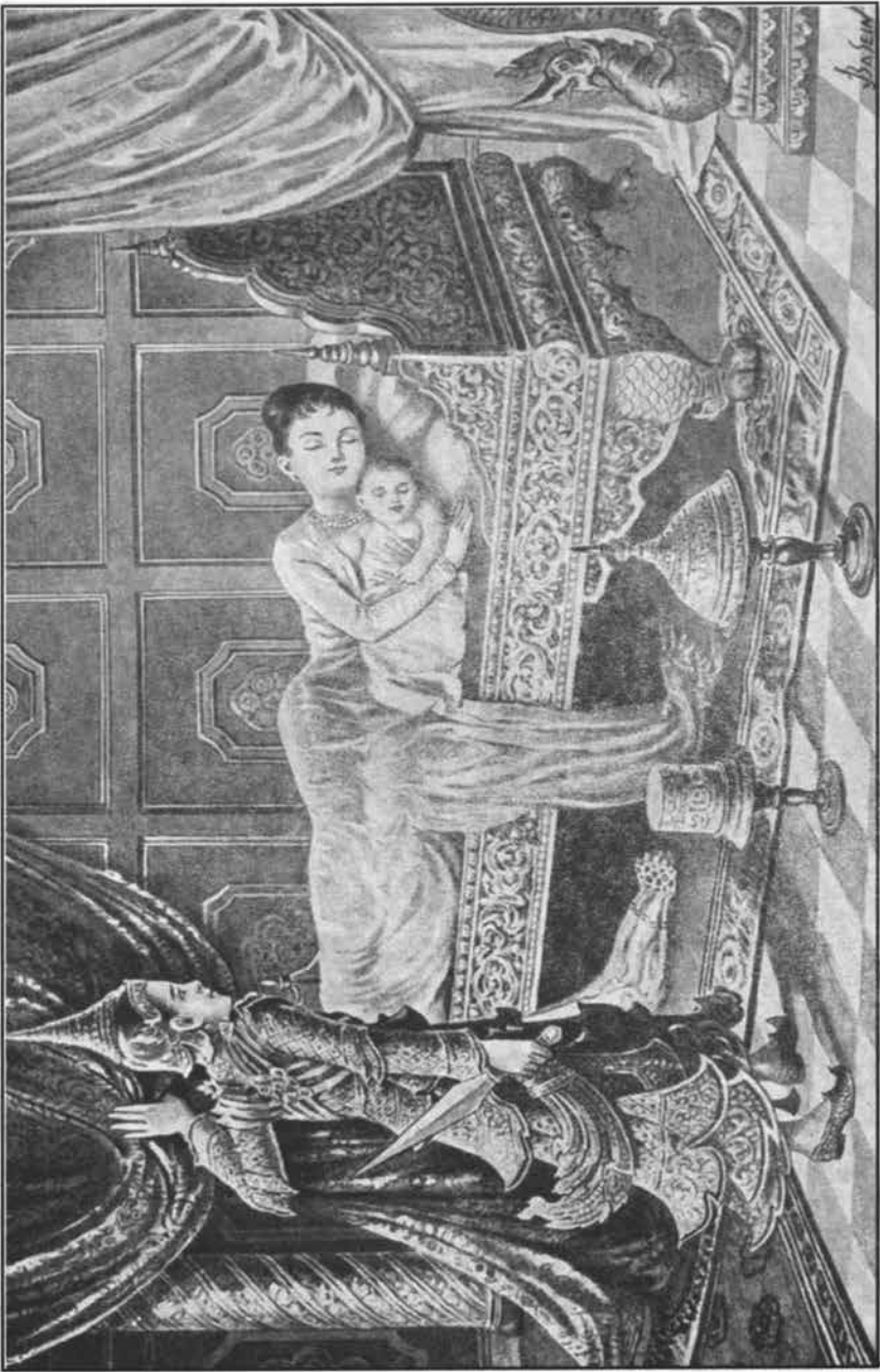
‘রাহুলের জন্ম, বঙ্গনের জন্ম’ :- কুমার রাহুলের জন্মে রাজকুমার সিদ্ধার্থের উক্তি ।